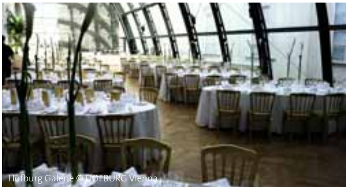
Hofburg Galerie