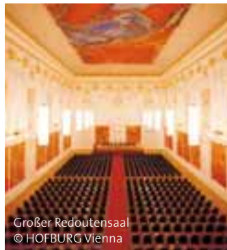
Großer Redoutensaal